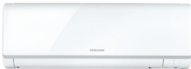
Biały/ szary pas, połysk

Seria T sprawdzi się wszędzie tam gdzie odpowiednia temperatura to priorytet. Jeżeli szukasz modelu funkcjonalnego i przystępnego cenowo wybierz serię T.