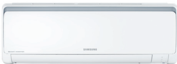
Biały/ szary pas, mat

Seria P+ to propozycja dla osób, które szukają cichego, energooszczędnego klimatyzatora w konkurencyjnej cenie.